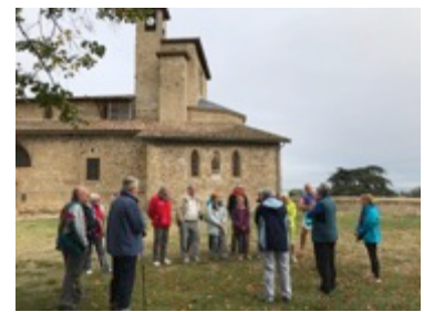
2 octobre: Association « C' la forme de Chatuzange »