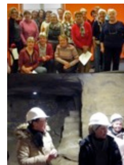
12 décembre: Association GFDA de Chabeuil