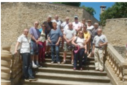
16 juin : Visite du village pour tous 4 juillet : visite du village organisée par Pays d'Art et d'Histoire

Les principales visites sont les suivantes :