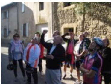
4 octobre: Cyclo-club Alixan (de retour de circuit)