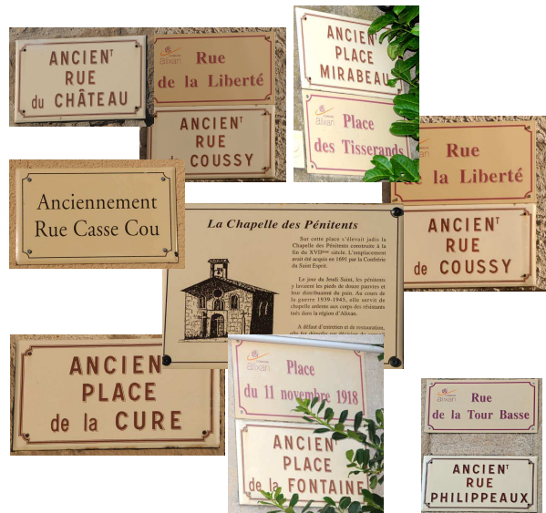
Poses de plaques émaillées avec les anciens noms de rues et place