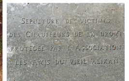
Restauration de la tombe de la famille Dorier victimes des chauffeurs de la Drôme

Restauration du tableau de l'église « Baptême du Christ par St Jean Baptiste »